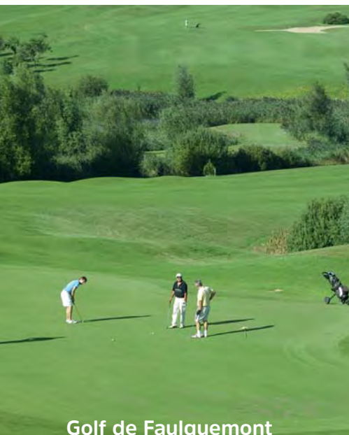
Golf de Faulquemont