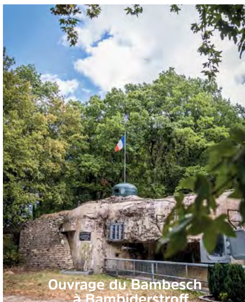
Ouvrage du Bambesch à Bambiderstroff