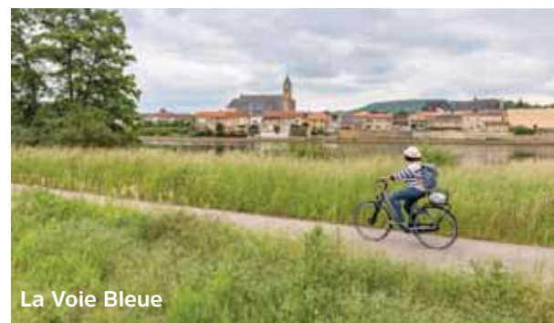
La Voie Bleue