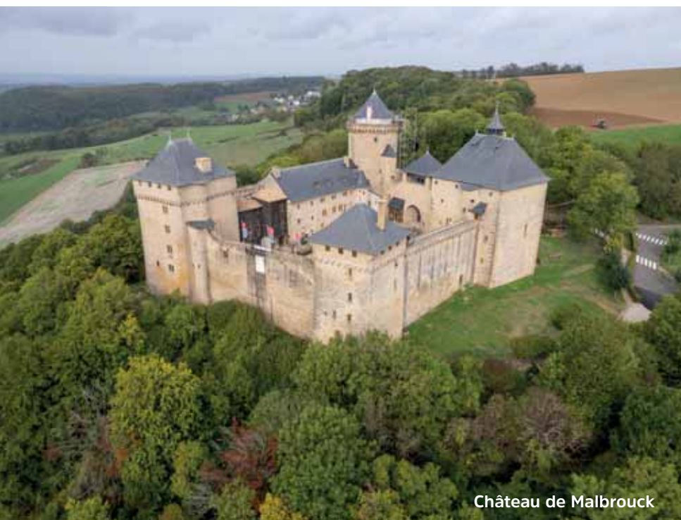
Château de Malbrouck