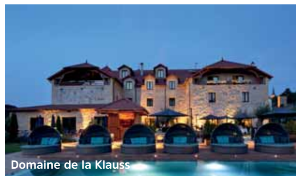
Domaine de la Klauss